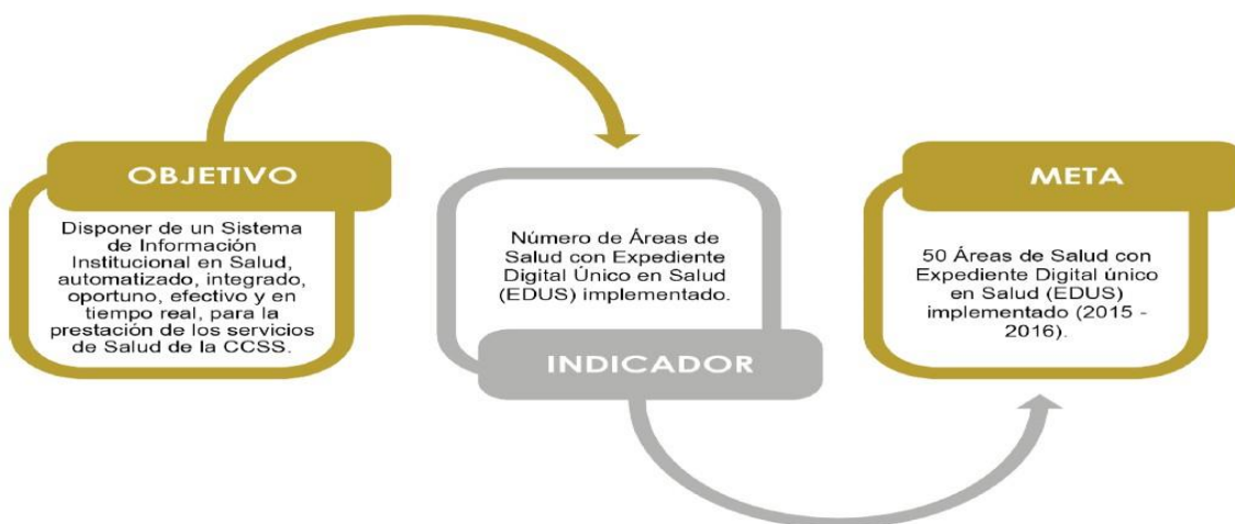
■ Ilustración 1. Ejemplo de la relación entre un objetivo, meta e indicador