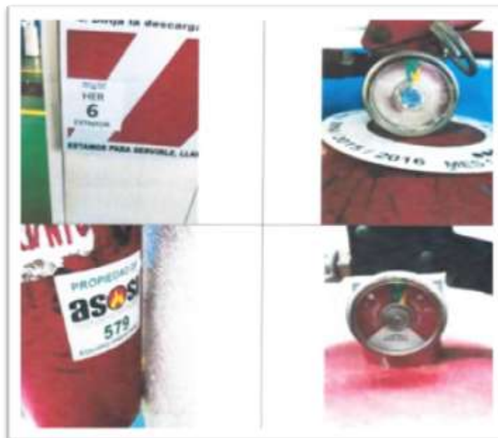
Extintores que el manómetro indica que tienen sobrecarga

Durante las fiscalizaciones realizadas se han detectado varios hallazgos sobre los extintores, ya que algunos de ellos presentan corrosión, el manómetro indica sobre cargas y abolladuras en el cilindro, además se han detectado falta de marchamos.