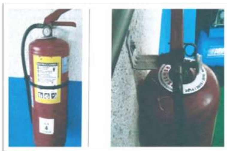
Extintores sin marchamo de seguridad