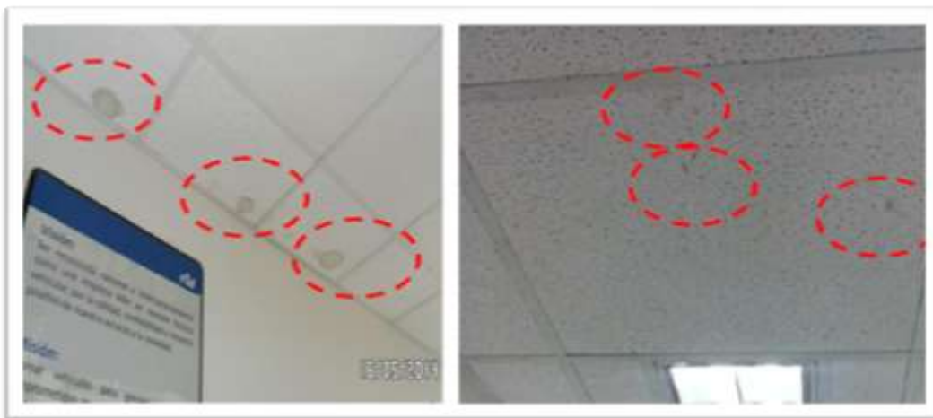
Manchas en el cielorraso

Este aspecto es evaluado constantemente en las fiscalizaciones ya que se da con mucha incidencia la detección de hallazgos en las estaciones. Dentro de lo que se ha detectado problemas con la pintura de instalaciones, problema por existencia de manchas en las paredes, manchas en láminas del cielo suspendido, toldos dañados, entre otros.