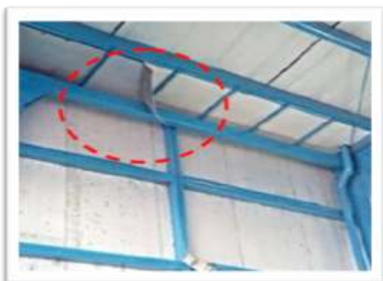
Lámina de material aislante desprendida